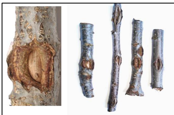
Figura1. Detalle de los canchros ocasionados por Phomopsis spp. en ramas de pecán

El síntoma más frecuentemente observado en el tronco principal y/o en las ramas, son los canchros (Fig. 1), los cuales se manifiestan como una lesión hundida con bordes de diversos tamaños.