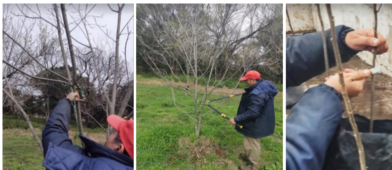
Figura 5. Uso de herramientas previamente desinfectadas para realizar podas y/o injertos.