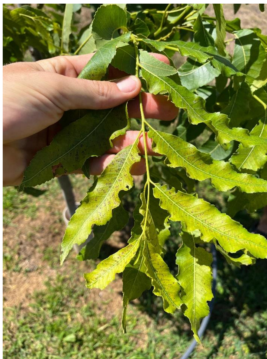
Imágenes 3 y 4. foliolo de pecan con déficit de zinc.