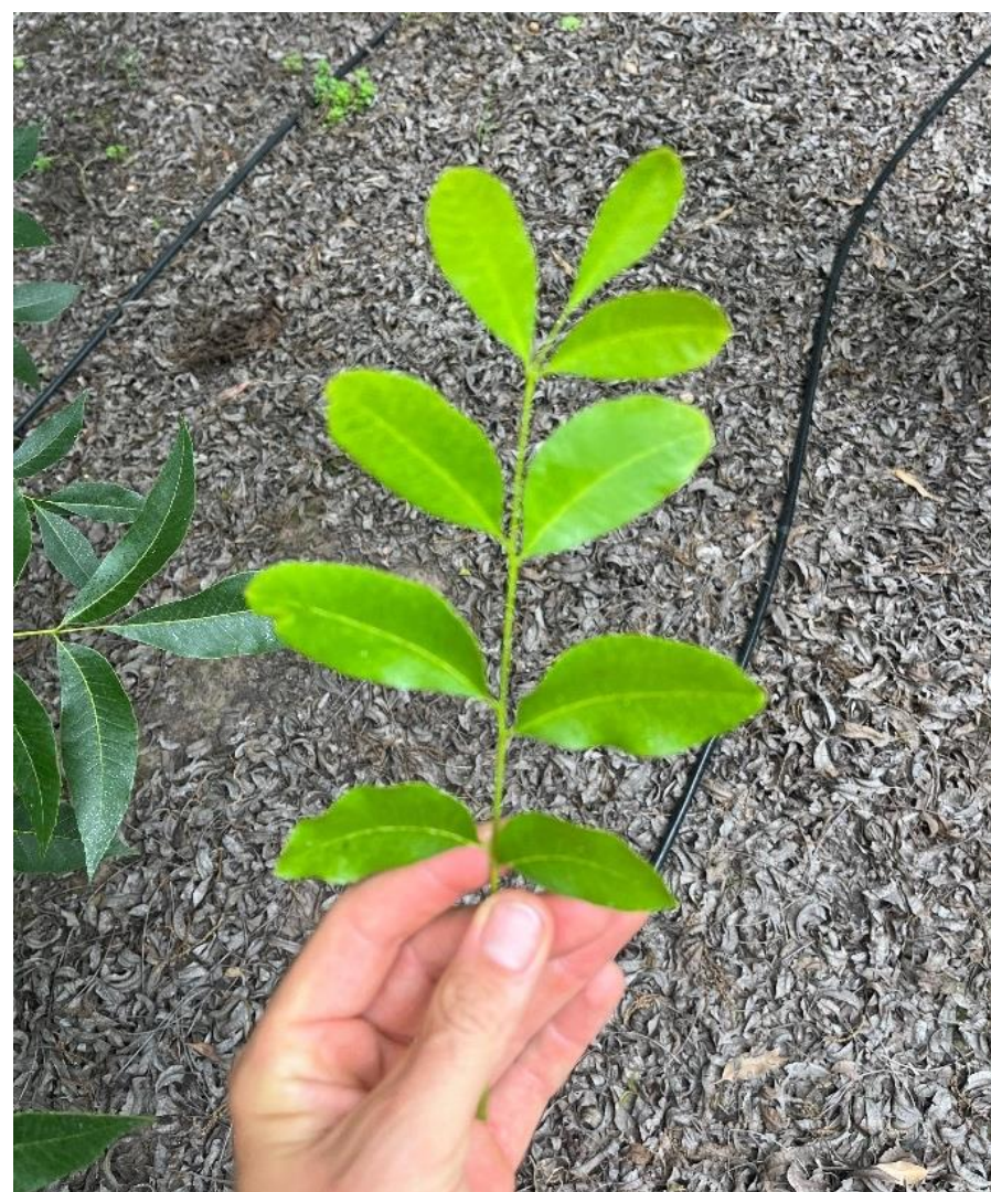
Imágenes 6 y 7. Foliolo de pecan con déficit de níquel.