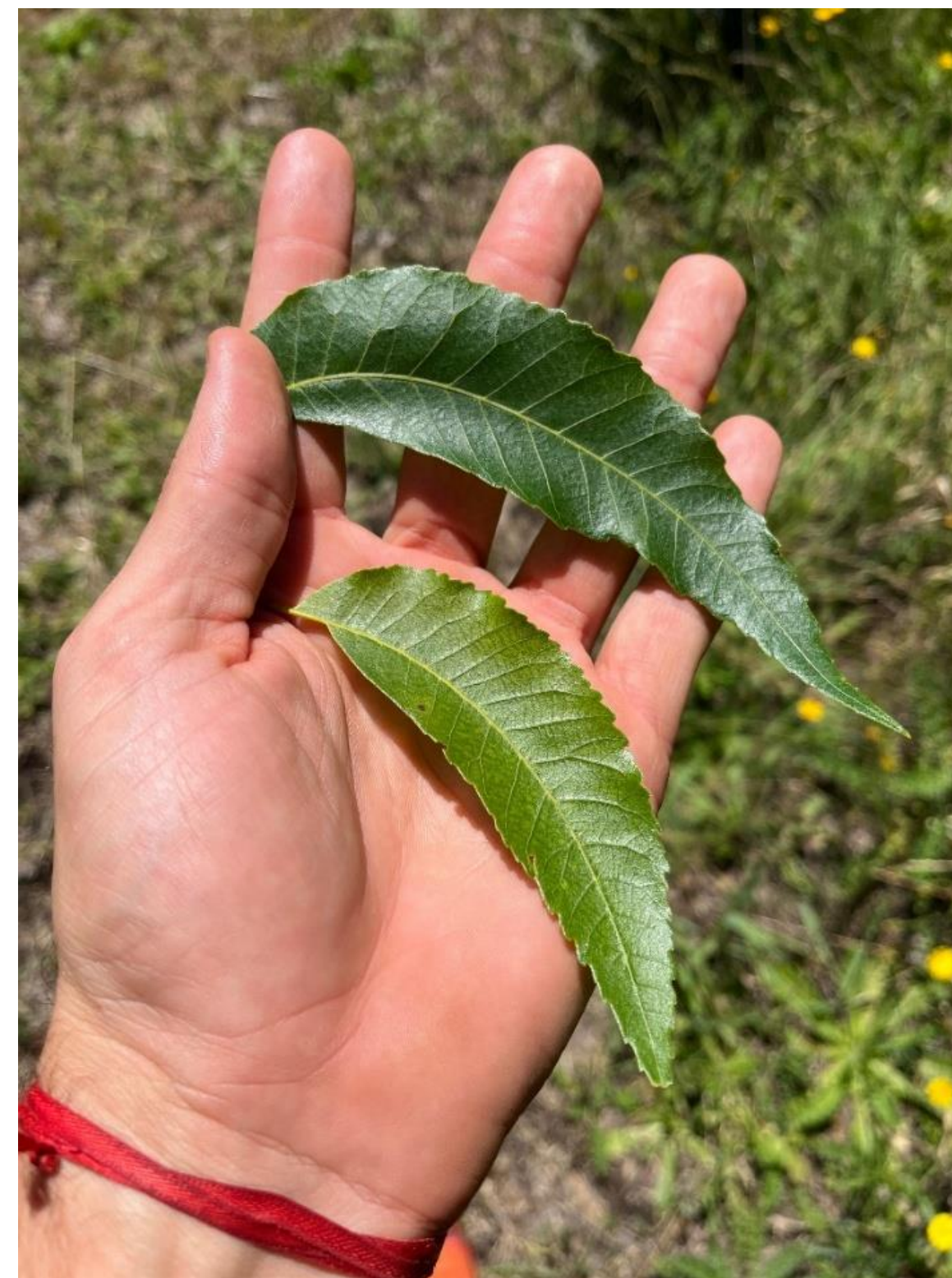
Imagen 1. Se puede observar la diferencia entre un foliolo de pecan con déficit de nitrógeno y un foliolo con contenido de nitrógeno óptimo.

Dado que es un nutriente con movilidad dentro de la planta, las deficiencias se presentan como una clorosis generalizada, como resultado del contenido reducido de clorofila, y comienza primero en las hojas adultas y específicamente en los folíolos basales que se tornan de un color verde amarillento pálido generalizado (Imagen 1), en una etapa más avanzada de la deficiencia, toda la planta se vuelve amarilla y las hojas se caen.