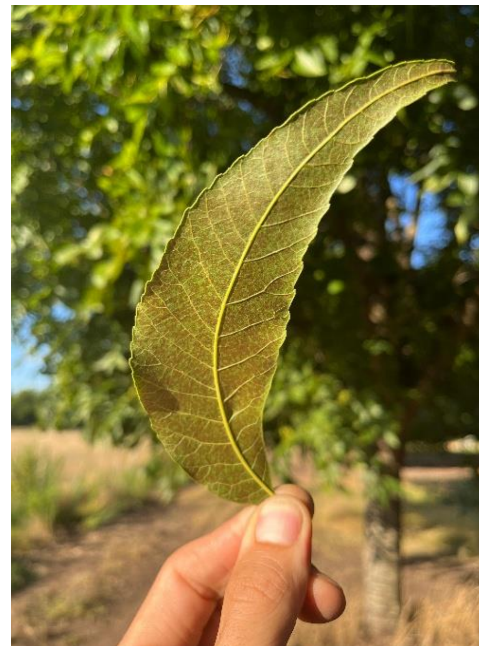
Imagen 2. foliolo de pecan con déficit de fósforo. (Gentileza del Ing. Agr. Martin Basso de Consultora Pecanes Mercedinos)

Los síntomas de la deficiencia se presentan primero en las hojas inferiores que desarrollan un color rojizo a partir de los bordes (Imagen 2), en cambio, cuando las hojas están bien provistas presentan un color verde oscuro.