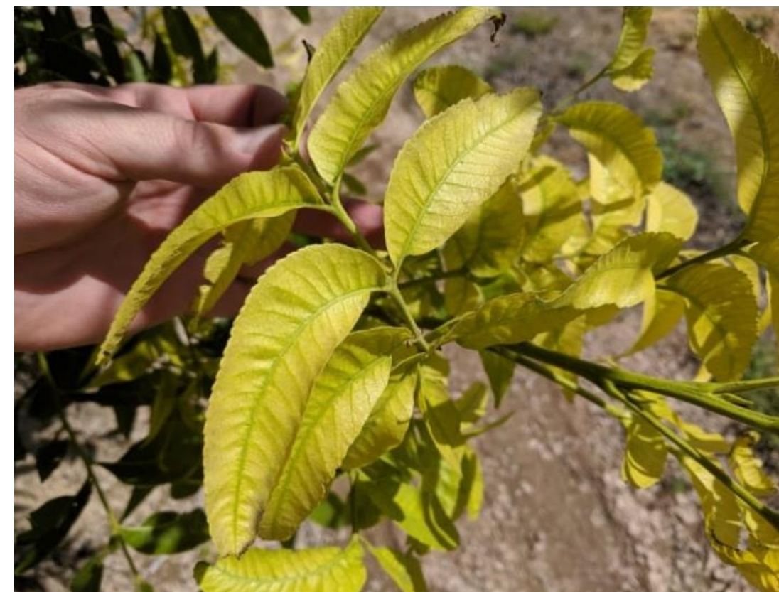
Imagen 5. Clorosis internerval en folíolos jóvenes de nogal pecan, típica de deficiencia de hierro.

Manganeso: participan en diversos procesos enzimáticos. Aunque su deficiencia no es común. Es un nutriente inmóvil, por lo tanto, los síntomas de deficiencia, como clorosis invernal o/o manchas necróticas, aparecen primero en las hojas más jóvenes.