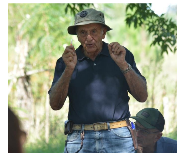
Editor: Ing. Agr. Alejandro Lavista Llanos